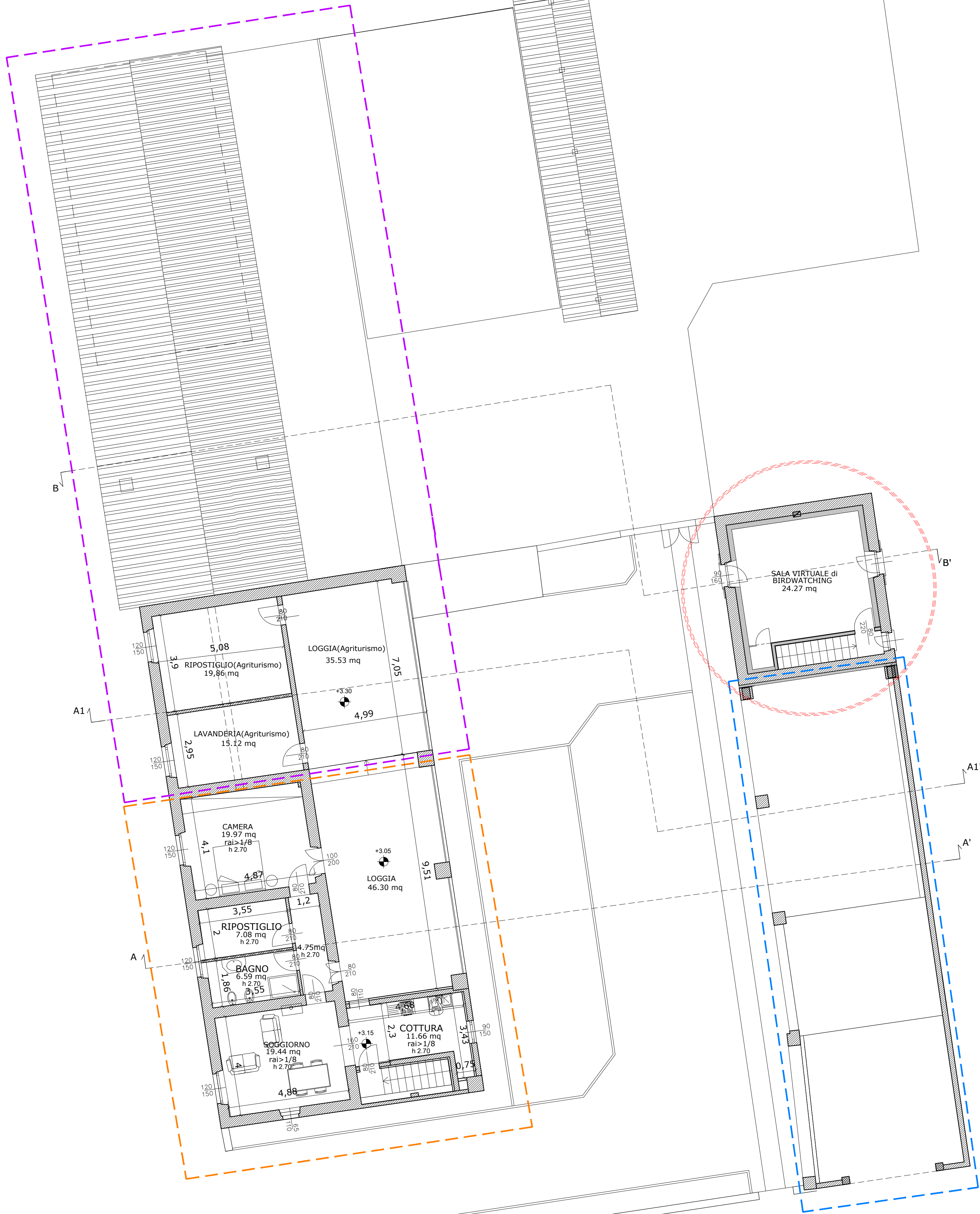
PROGETTO PIANTA PIANO PRIMO scala 1 : 100

INTERVENTO INFRASTRUTTURA AGRICOLA BANDO REGIONE LOMBARDIA "SRD 01" INTERVENTO IN CONNESSIONE AGRICOLA BANDO REGIONE LOMBARDIA "SRD 03"