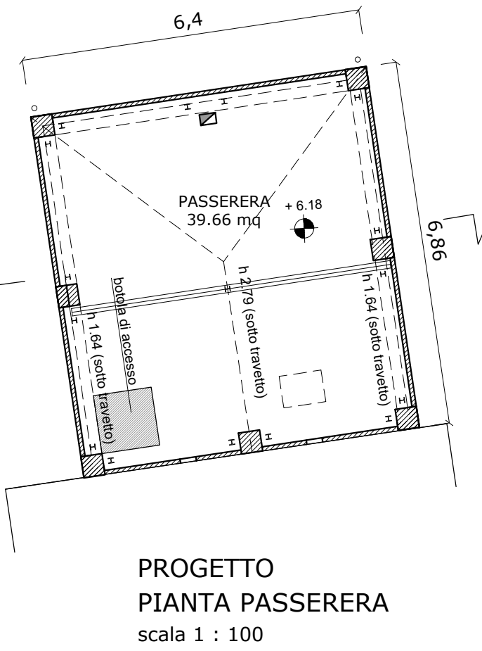
PROGETTO PIANTA PASSERERA scala 1 : 100

ABITAZIONE IMPRENDITORE AGRICOLO IN CORSO DI ESECUZIONE (SCIA prot. 11364 del 28.05.2024)